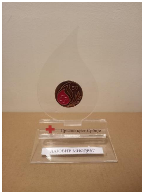
Слика 26. Добровољни даваоци крви , наставник Миодраг Лајовић