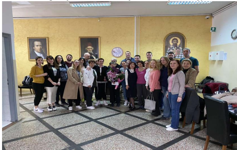
• Слика 15. Испраћај пензинера