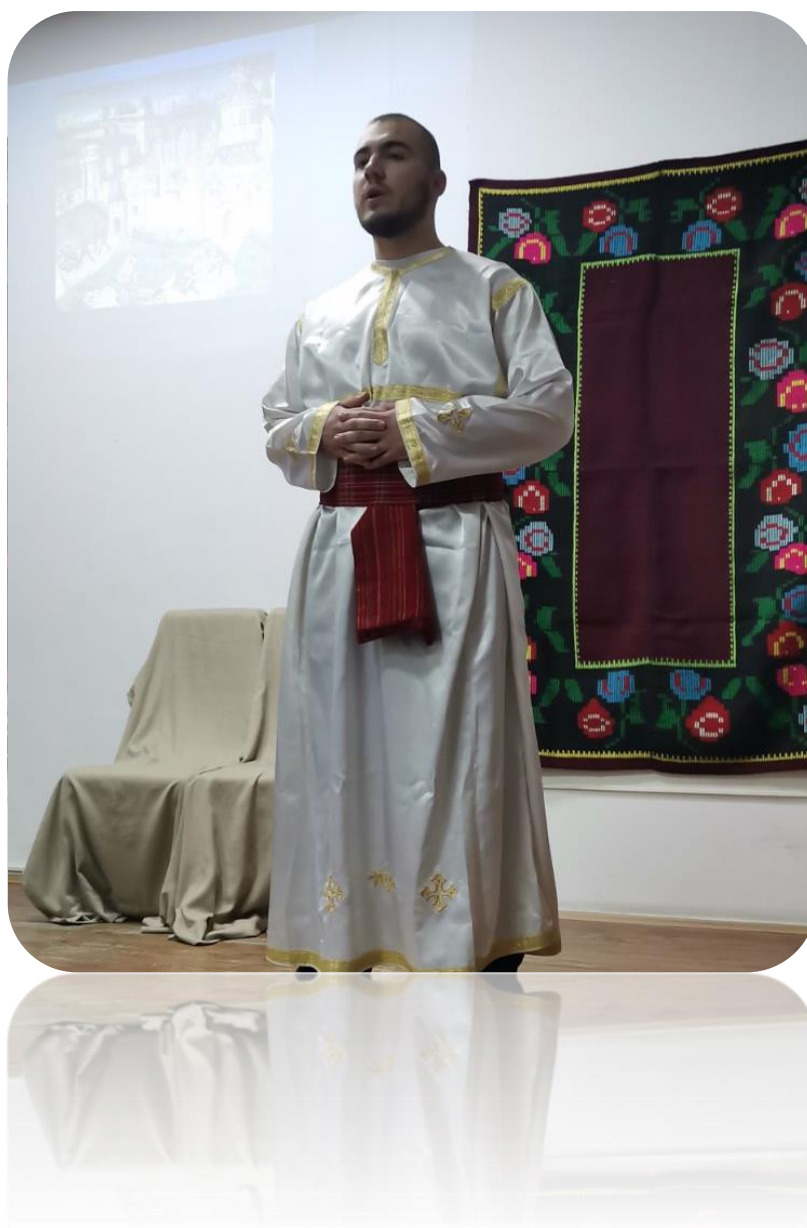
Слика 14. Приредба за школску славу Светог Саву