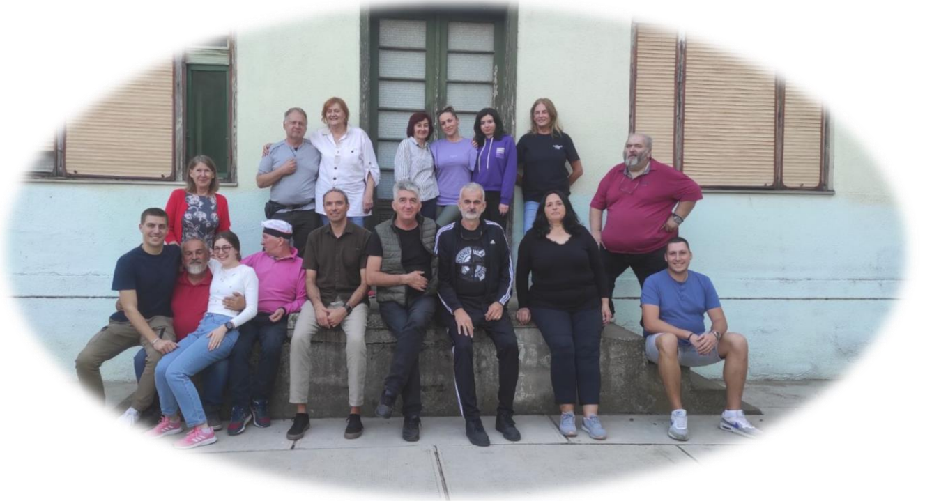
Слика 11. Дружење колектива са пензионерима