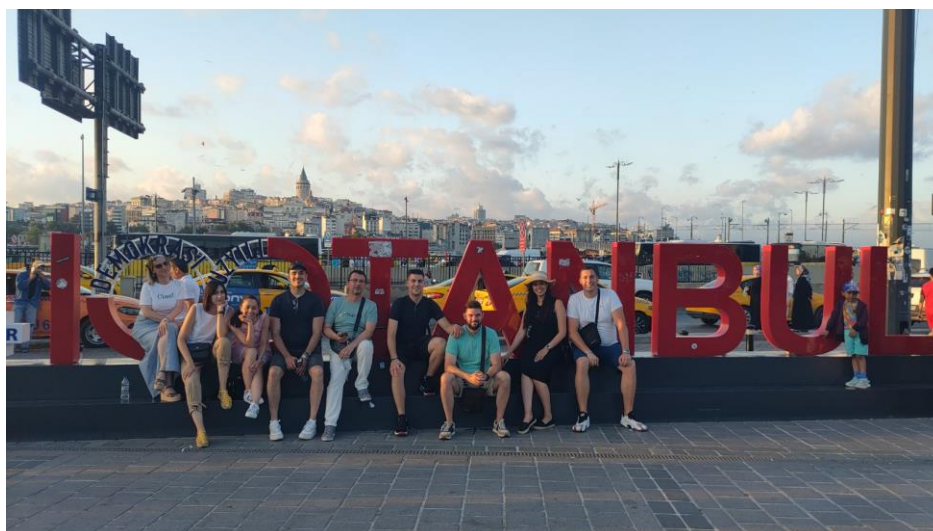
• Слика 18. Стручно едукативна екскурзија запослених