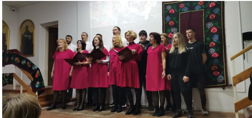
Слика 4. Школски хор