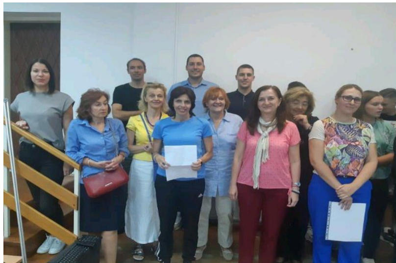
Слика 6. Припрема Школског хор за приредбу за Дан школе