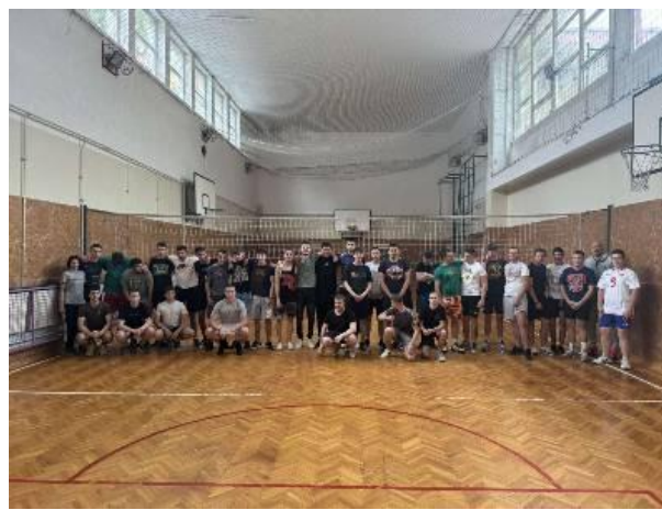
Слика 22. “ Турнир сећања и заједништва“ у одбојци.