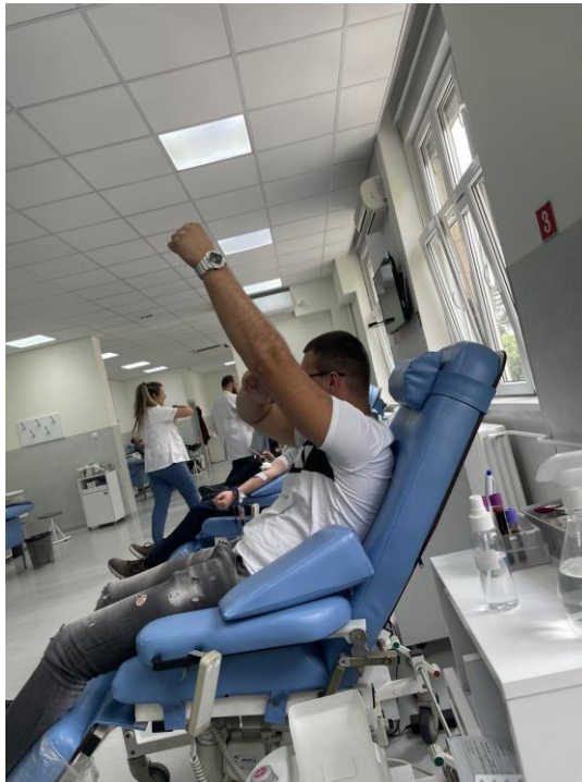
Слика23. Добровољни даваоци крви