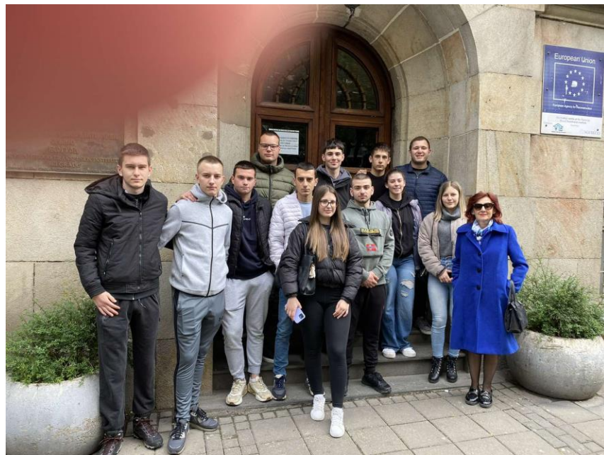
Слика24. Добровољни даваоци крви