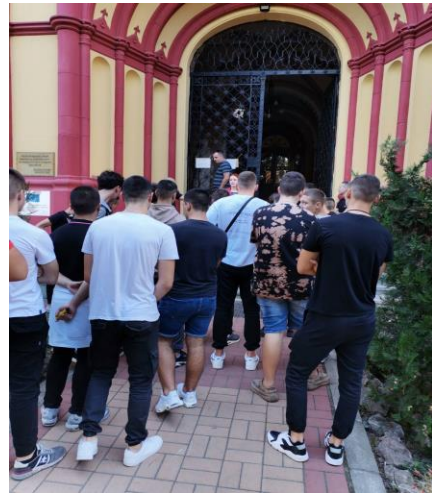
Слика .13. Наши ученици у Карловачкој Гимназији