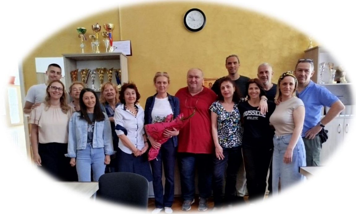
• Слика 17. Испраћај пензинера