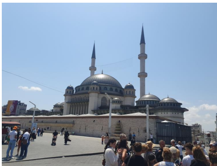
• Слика 19. Стручно едукативна екскурзија запослених