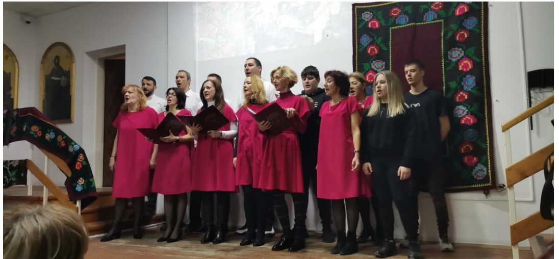
Слика 13. Школски хор за Светосавку академију 27.01.2024. године