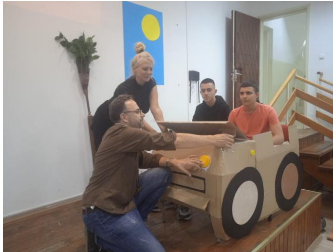
Слика5.Припрема приредбе за Дан школе