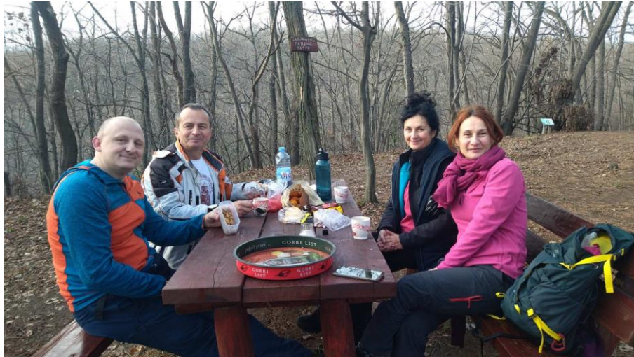
Слика 10. Планинарска акција „ Фрушка Гора.“