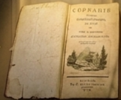
Собраније (1793) – Збирка наравоучителних ствари штампана у Бечу.