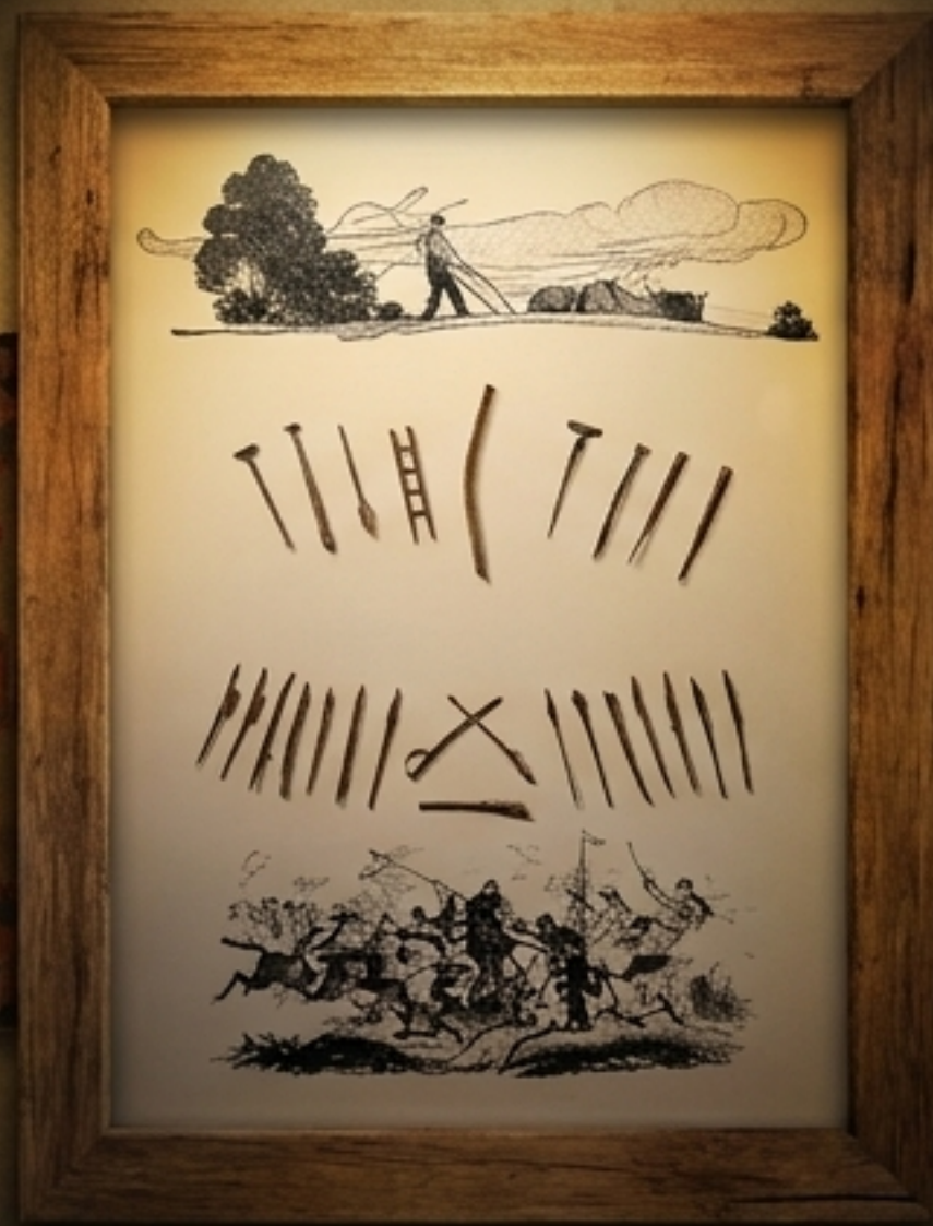
Грубо ратничко друштво и хајдучка пушка.