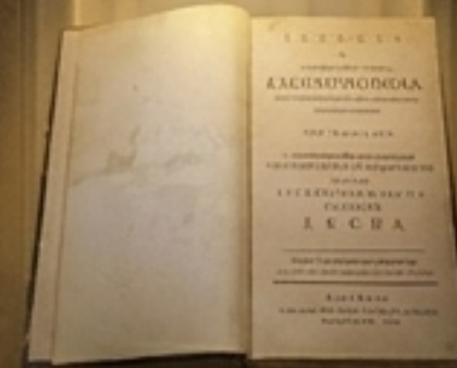
Басне – Алат за морално подучавање кроз народну причљивост.

Тек се не узда један народ никад до вијека к просвештенију разума доћи у којему жене у простоти и варварству остају.