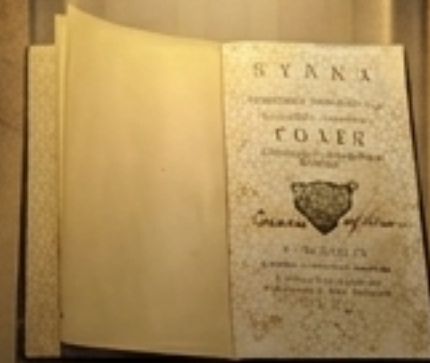
Етика (1803) – Превод филозофских дела, кључно за етичко образовање.