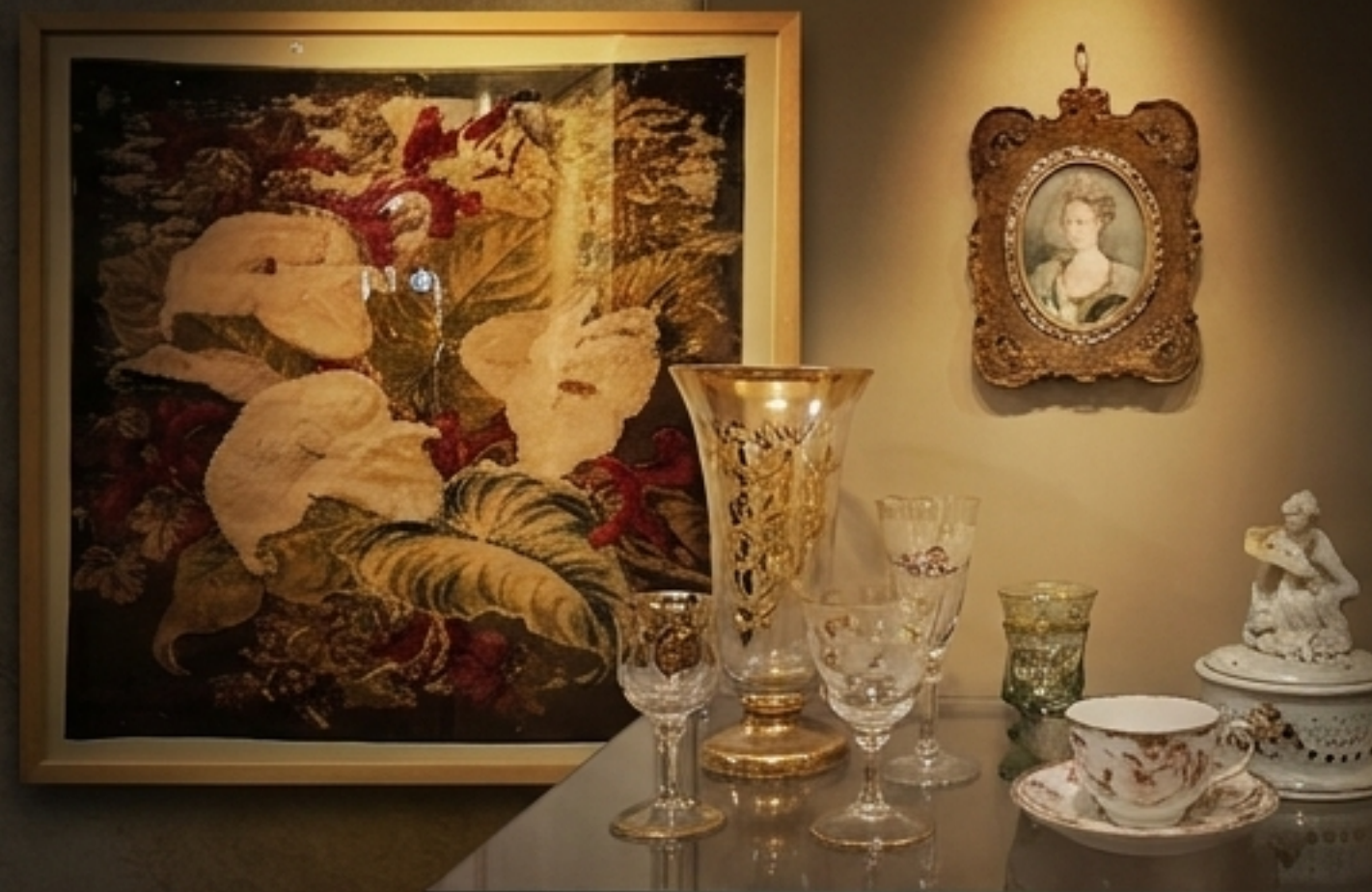
Рафинирана грађанска Европа, фино стакло и уметност.

Музеј чува фини нит транзиције. Током само једног века, Србија је прешла пут од хајдучке пушке до венецијанске етике. Оружје је створило државу, али су књиге и култура створиле нацију.